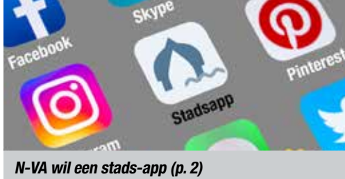
N-VA wil een stads-app (p. 2)