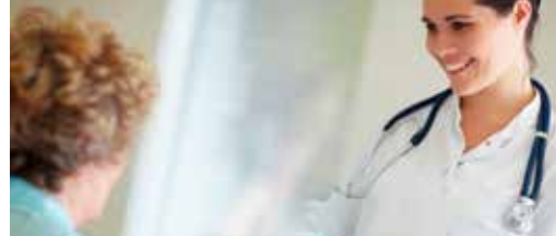
N-VA stelt zorgparkeren voor (p. 3)