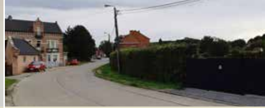
Wanneer gaan de werken Op 't Hof van start? (p. 3)